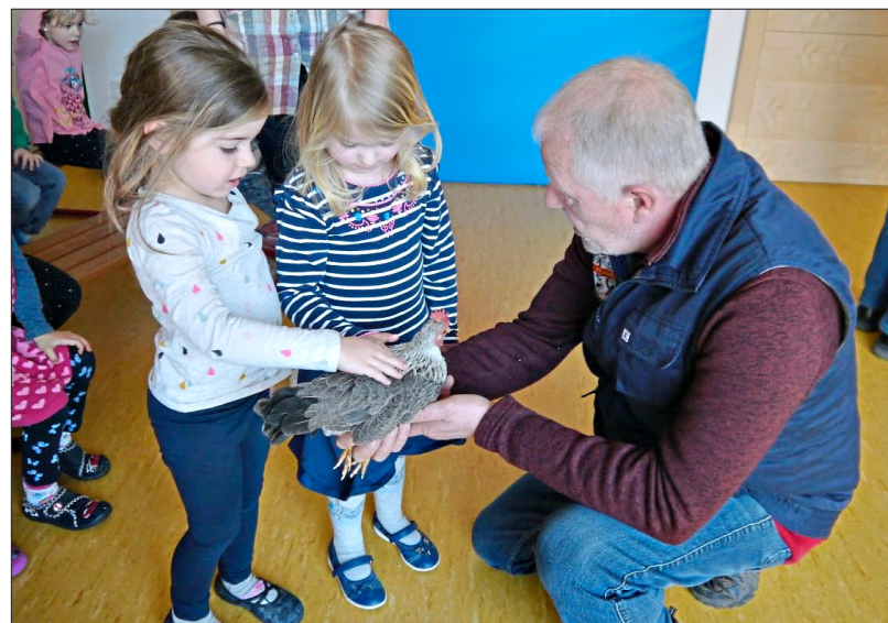
Im Haus für Kinder durften die Kleinen Hennen und Gockel streicheln.

Damit die Kinder einen Eindruck bekommen, wie sich das Federkleid anfühlt, durften sie das Federvieh zum Abschluss vorsichtig streicheln. – bo