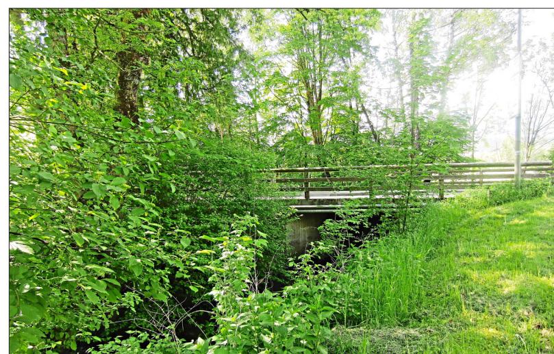
Die Brücke an der Bahnhofstraße im Teisendorfer Ortsteil Karlsbach soll erneuert werden.

Der Ramsauer Bach zeigt sich den Teisendorfern meist als kleines Bächlein, das in vielen, oft ausladenden Kurven träge dahinfließt. Er entsteht im Höglwörther See und mündet im Teisendorfer Ortsteil Karlsbach in die Sur. Wenn der Bach bei Hochwasser deutlich anschwillt, kann er zum Problem werden. Er verursacht Überschwemmungen und bringt der Sur das Wasser, dass dort sprichwörtlich „das Fass zum Überlaufen bringt“. Auch die Brücke an der Staatstraße durch Tei-