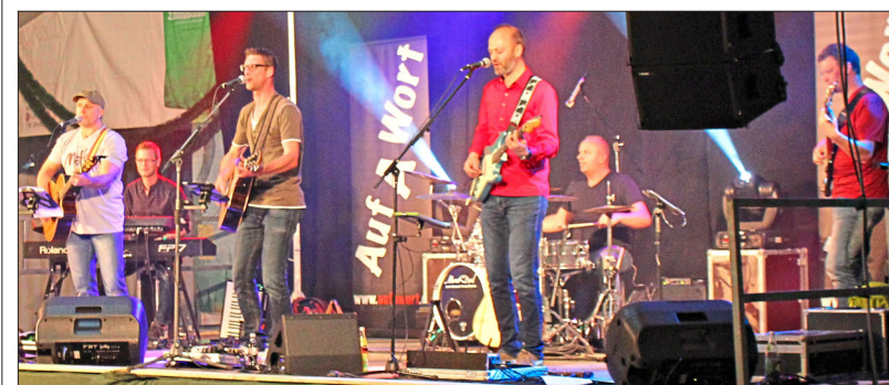
Die Austropop-Gruppe „Auf a Wort“ eröffnete am Dienstag das Lauterer Maifest.

Die Maifestgemeinschaft Lauter hofft auf zahlreiche Helfer beim Zeltabbau. Arbeitsbeginn am Feuerwehrhaus in Lauter ist am Samstag um 8 Uhr.